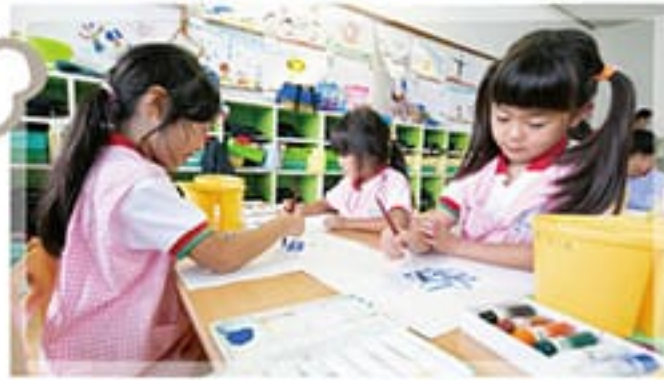
● 絵画教室(5~4歳児)月1回 のびのびした表現を楽しむ