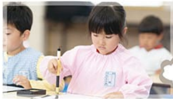
● 書道教室(5歳児)月1回 書・墨字に慣れ親しむ