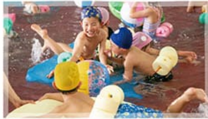
● 水泳教室(5~4歳児)月2回 体力・集中力を養う