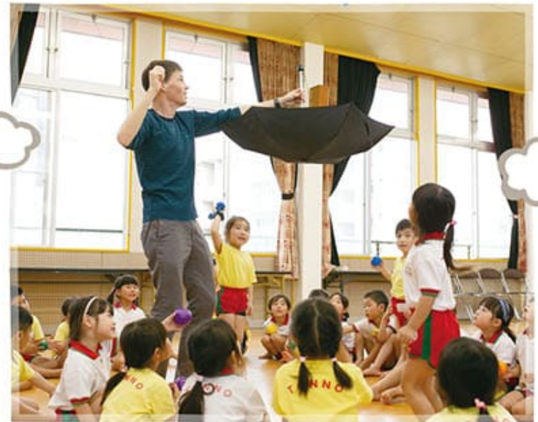
● 英会話教室(5歳児)月1回 将来の国際人を目指す