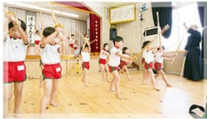
● 剣道教室(5歳児)月1回 礼に始まり礼に終わる